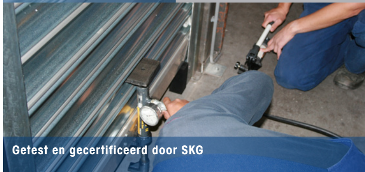
Gefest en gecertificeerd door SKG